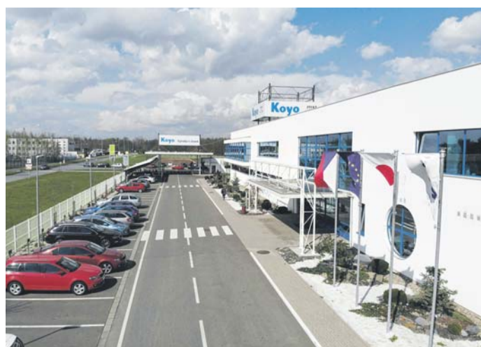
Koyo Bearings Česká republika.