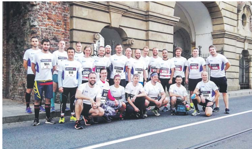
Zaměstnanci na letošním olomouckém půlmaratonu.

Náborový příspěvek nabízí firma pro většinu otevřených pozic, a to ve výši 15.000 Kč. Aby zároveň podpořila spokojenost stávajících zaměstnanců, na-